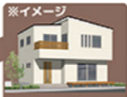
※イメージ モデルハウス(予定)の分譲地です。