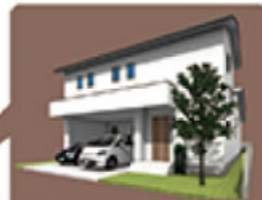
モデルハウスのある分譲地です。